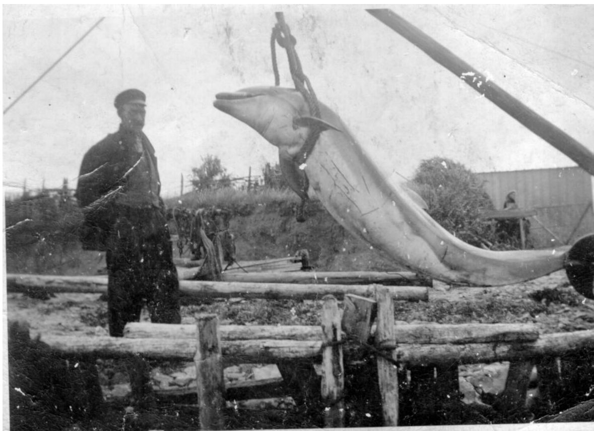
Øresvin fanget ved Vigsø på Nordvestfalster i 1940'erne.

Størrelsen og det velafsatte mellemlange næb gør at øresvinet normalt ikke forveksles med andre delfiner. På længere afstand kan der dog ske forvekslinger med andre arter med mellemlangt næb. Henfaldne dyr kan minde om hvidnæsere, så man bør kigge efter en ekstra gang.